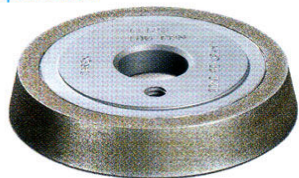
Meule DIA 76,05 D x 16,25 B